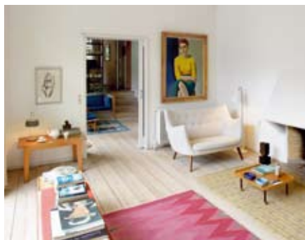
Fra Finn Juhls hus

PP Møbler i Allerød fremstiller mange af Wegners klassikere under anvendelse af avanceret og innovativt snedkerhåndværk.