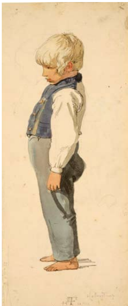
Stående vogterdreng med blå vest. 1845

I Danmark mødte Frølich ikke stor opbakning og fik af sin samtid rollen som