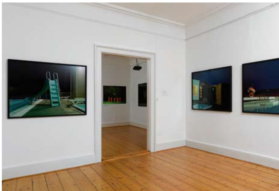
SAMTIDSKUNST: Fra Astrid Kruse Jensens udstilling Between the Real and the Imaginary