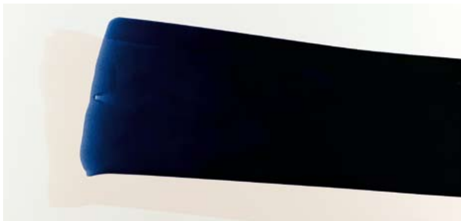
Signe Guttormsen: Reset I. 1999

Vi bringer teksterne fra udstillingen "Det seneste nye", der sætter fokus på museets indsamlingspolitik.