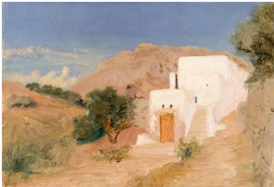
Hvidt hus ved Neapel. 1848. Ribe Kunstmuseum

”den lidt skæve guldaldermaler”. Han var splittet mellem sit hjemland og verden, mellem fortid og fremtid, mellem konformitet og provokation. Måske er det netop denne splittelse, der gør ham interessant i dag, 100 år efter hans død.