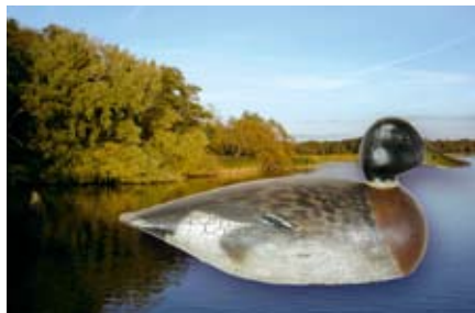
Svend-Allan Sørensen: Lokkeand, 2009

Ud over de fem udstillinger omfatter projektet en fælles bogudgivelse med titlen Af sted samt et fælles formidlingsprojekt Myplace.