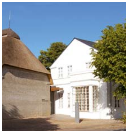
Museum Kunst der Westküste.

Pris for rejse og ophold 2.889 kr. pr. person. Tillæg for enkeltværelse 200 kr.