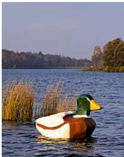
Svend-Allan Sørensen: Lokkeand.