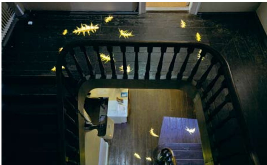
Carl Emil Carlsen: Infected area. Foto: Anders Sune Berg.