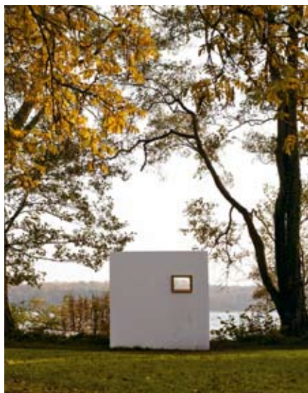
Ulrik Weck: Udsigt over Sorø sø. Foto: Anders Sune Berg.