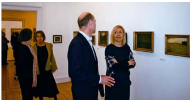
Venneforeningen inviterede Kulturministeren på besøg i museet.